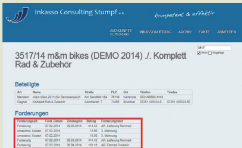
Inkassoüberlauf in Echtzeit